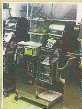
方便病人 浸大中醫藥中心提供煎藥服務，令病人能夠更方便地服食中藥。

另外，化療還會導致周圍神經病變，手脚麻痺是常見副作用之一，嚴重者甚至可能演變為永久問題，西醫暫無有效藥物，中醫則可通過針灸、藥水浸腳等舒緩麻痺；而鼻咽癌病人做化療出現的頭暈、口乾等長久副作用，亦能通過針灸改善；胃腸道基質瘤病人服用標靶藥後，有機會出現嚴重皮膚疹，西醫雖可處方類固醇，但劑量太高會引起嚴重副作用，中醫可使用中藥和針灸配合治療，將類固醇的劑量減低。