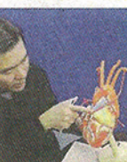
家庭醫生睇醫生 搭橋換心 抗第二號殺手 D2、3