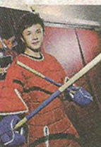
Happy Hours 菲律賓魔杖 對戰招式千變 D7