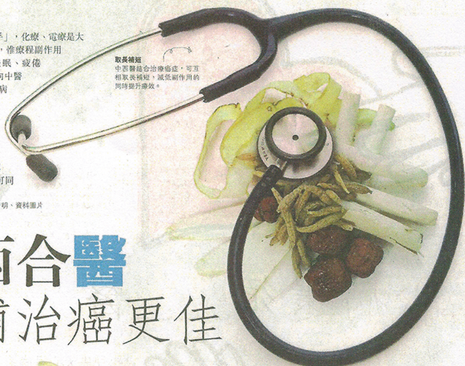
取長補短 中西醫適合治療癌症，可互相取長補短，減低副作用的同時提升療效。