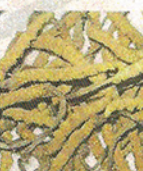
百子種 藥補不如食補 D6